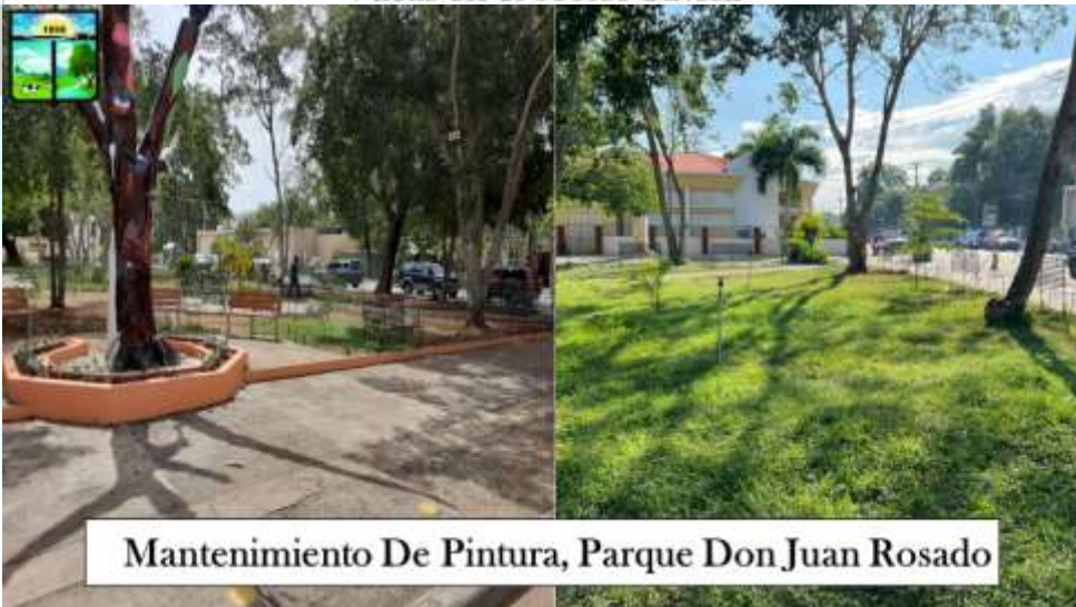
Mantenimiento De Pintura, Parque Don Juan Rosado