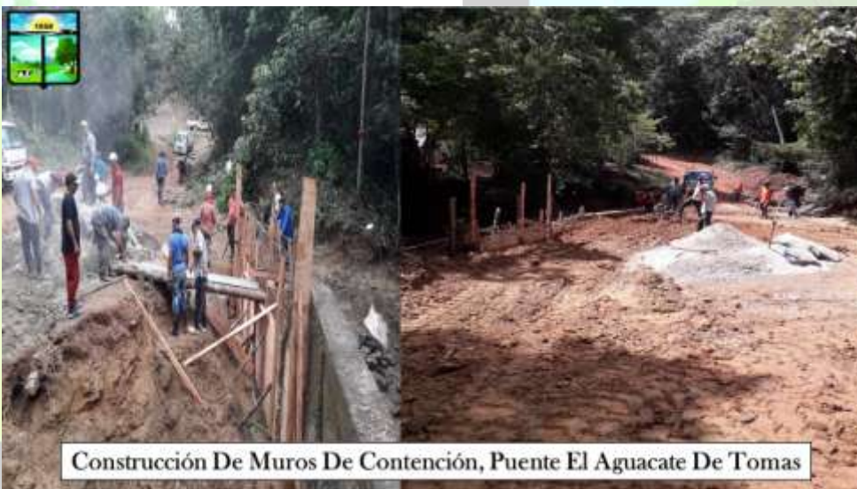
Construcción De Muros De Contención, Puente El Aguacate De Tomas