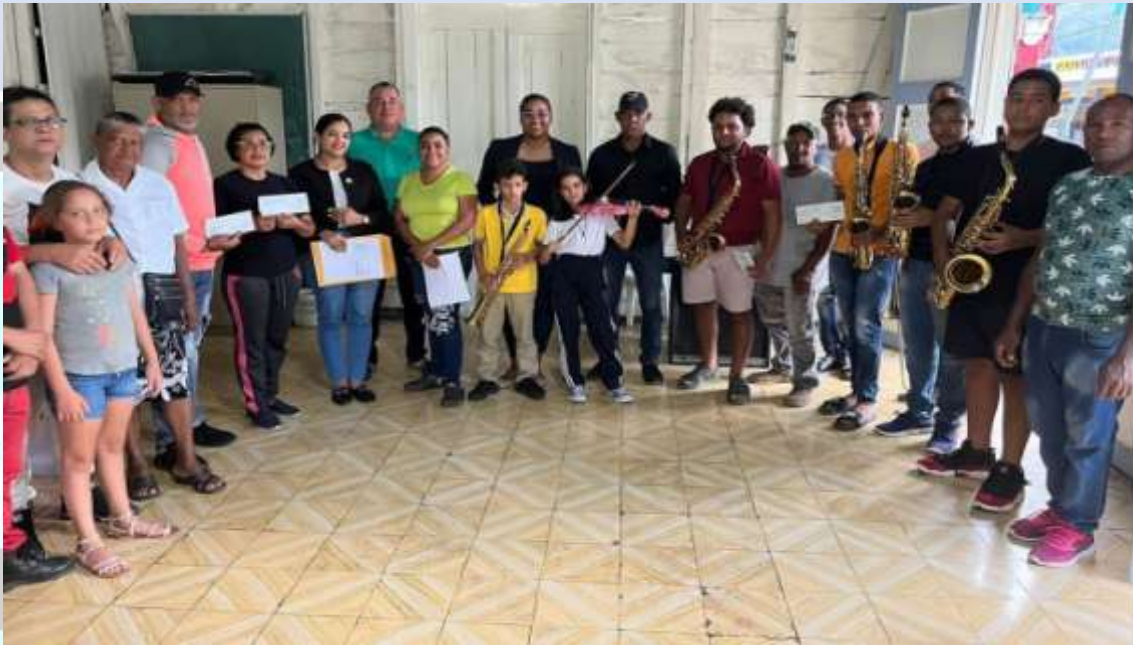
Apoyo Escuela De Música Don Juan Rosado