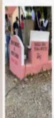
PARQUE AGUA CLARA, MONTE LLANO