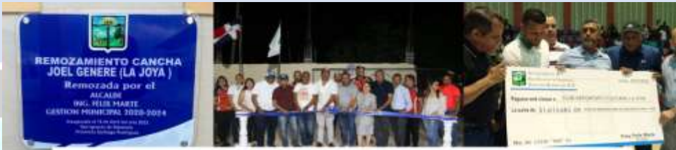
Remozamiento Cancha Joel Genere (La Joya)