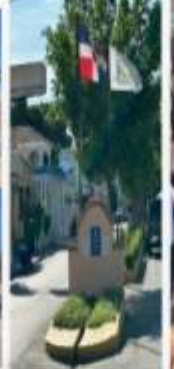
BULEVAR DE LA SANCHEZ