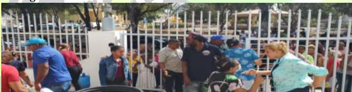
Entrega De 9 Mil Litros De Leche Para La Semana Santa