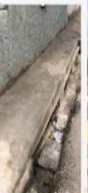
CANALETA E IMBORNALES