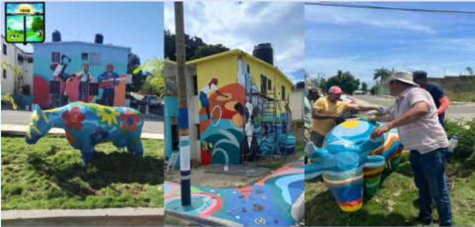
Remozamiento Bulevar, Pintura a Murales mas Colocación de Vacas en el sector Sávida