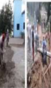
CONSTRUCCIÓN DE CALZADAS Y PISO, P. LAS MERCEDES