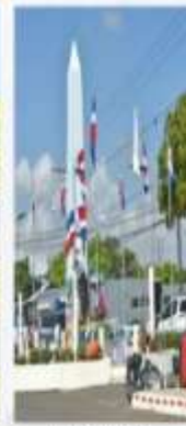
REMEDIACIÓN MONUMENTO A LOS HÉROES DE LA RESTAURACIÓN