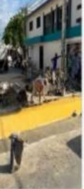
BADEN REDUCTOR DE VELOCIDAD, C/ JOSE MARTE