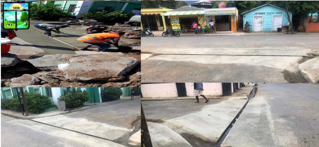
Construcción De Baden, C/ Sánchez Frente Al Polideportivo