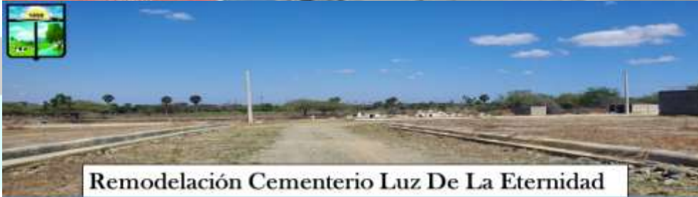
Remodelación Cementerio Luz De La Eternidad