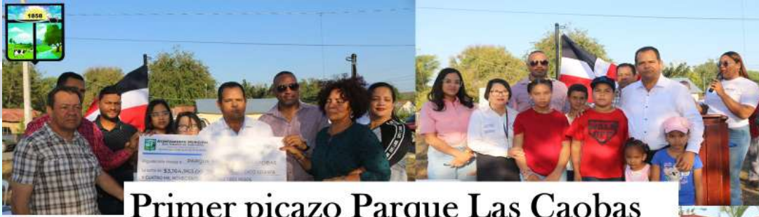
Primer picazo Parque Las Caobas