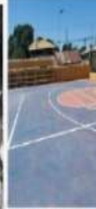
RECONSTRUCCIÓN CANCHA DEL TAMARINDO

CONOCE PARTE DE NUESTRA Tres años Transformando la Municipalidad