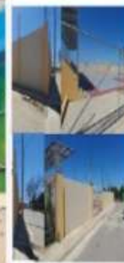
CONSTRUCCIÓN DE VERJA PERIMETRAL, CANCHA LA JOVA