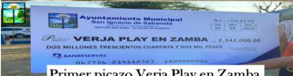
Primer picazo Verja Play en Zamba