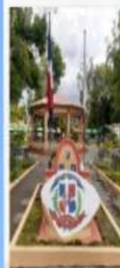
REMEDIACIÓN PIEDRA DEL PARQUE DON JUAN ROSADO