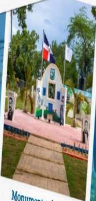
Monumento al General Santiago Rodríguez