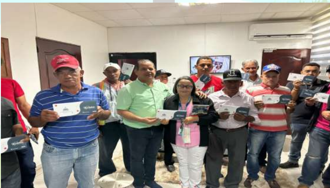
Entrega De Bonos Navideños