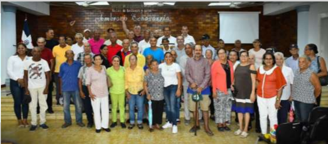
Entrega De 120 Pensiones Solidarias A Envejecientes