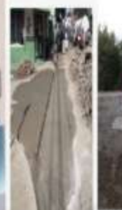
CONSTRUCCIÓN DE MÁS DE 85 BADENES